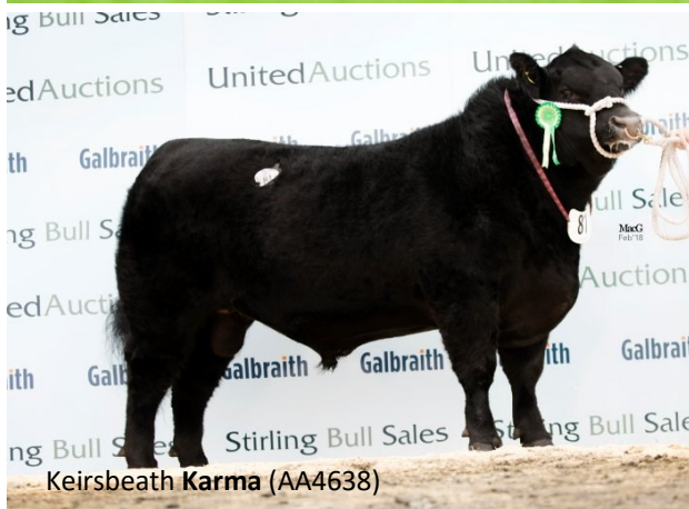
Keirsbeath Karma (AA4638)