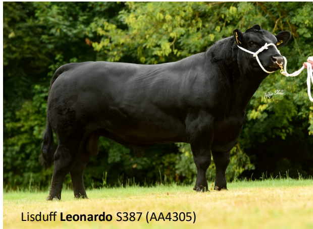
Lisduff Leonardo S387 (AA4305)