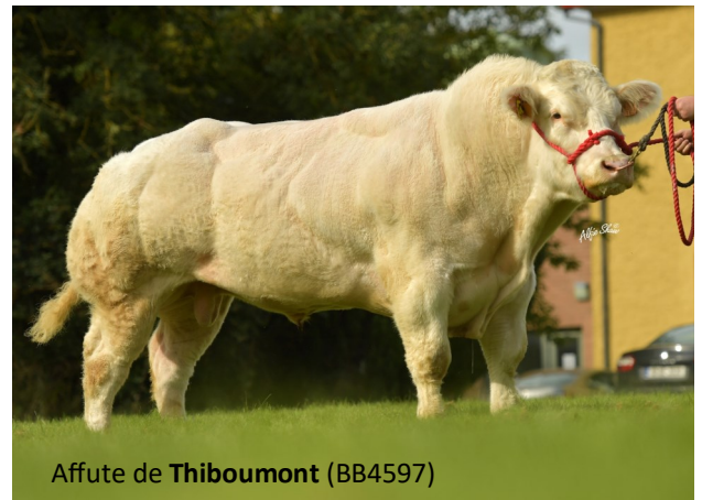
Affute de Thiboumont (BB4597)