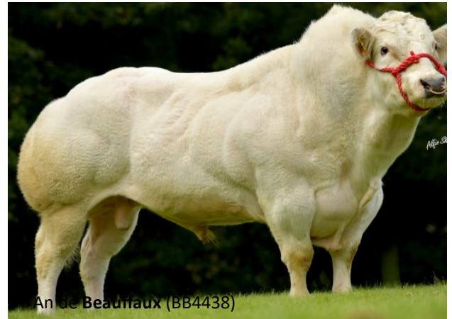
An de Beaufraux (BB4438)