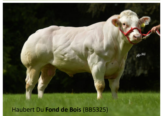
Haubert Du Fond de Bois (BB5325)

O sémen Triple Range não só oferece a possibilidade de produzir um animal cruzado de maior valor, como também promove o aumento das taxas de concepção.