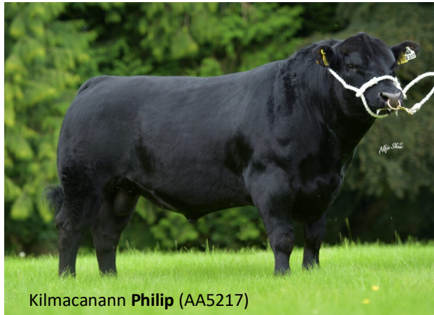
Kilmacanann Philip (AA5217)